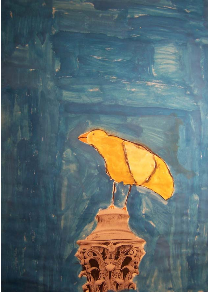
„Zwischennutzung“ der Friedenssäule am Mehringplatz – eine Friedenstaube